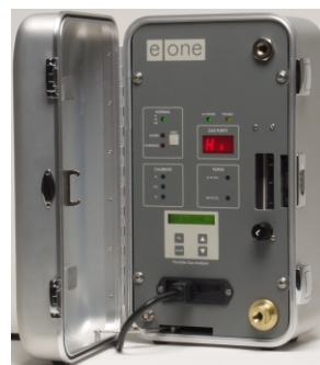
便携式氢气分析器(PGA)